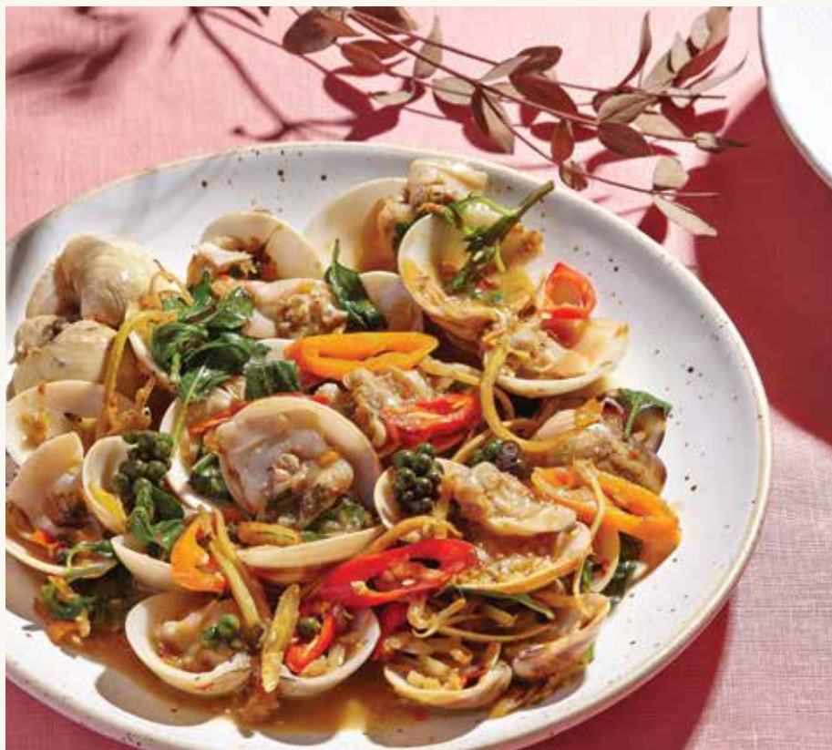
หอยตลับอบโหระพา ขนมปังน้ำพริกเผา Baked Chili and Basil Clams with Toast