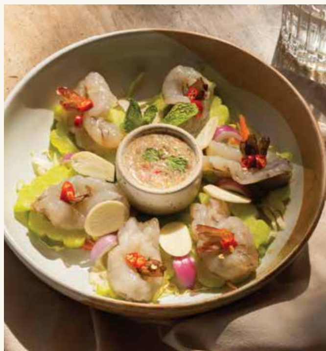
ยำคอหมูย่างปลาร้า Spicy Grilled Pork Neck Salad with Pickle Fish