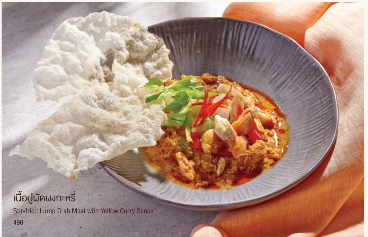
เนื้อปูผัดผงกะหรี่

Stir-fried Lump Crab Meat with Yellow Curry Sauce 490.-