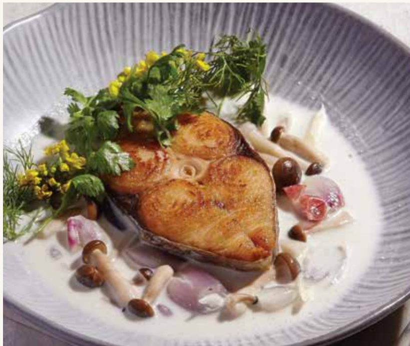
ต้มกะทิปลาอินทรีแดดเดียว 370.- Coconut Soup with Sun-Dried Mackerels