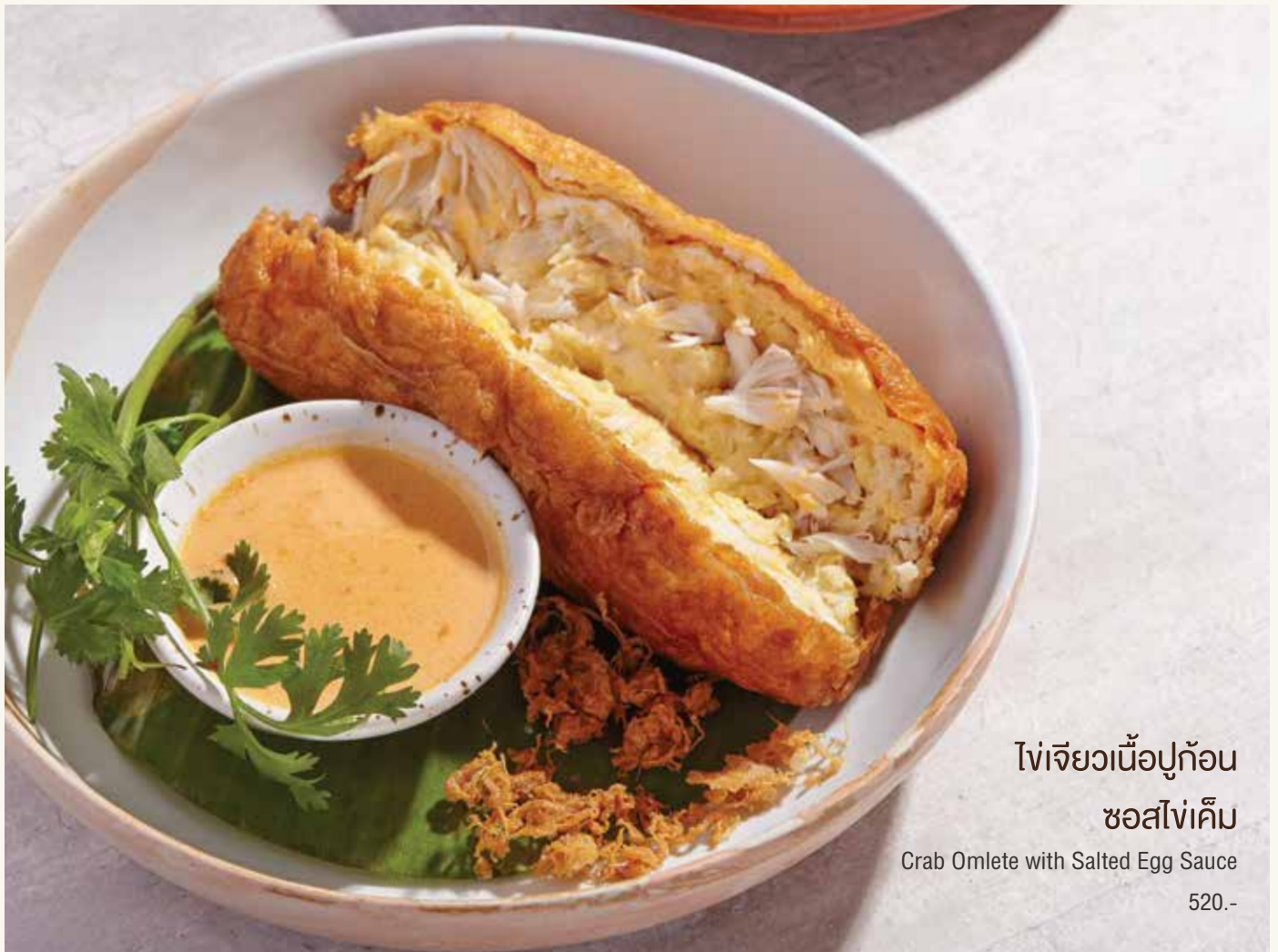
ไข่เจียวเนื้อปูก้อน ซอสไข่เค็ม