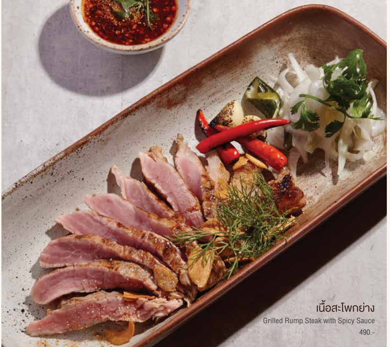
เนื้อสะโพกย่าง Grilled Rump Steak with Spicy Sauce 490.-