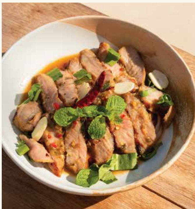
ส้มตำไทยไข่เค็ม Papaya Salad with Salted Egg