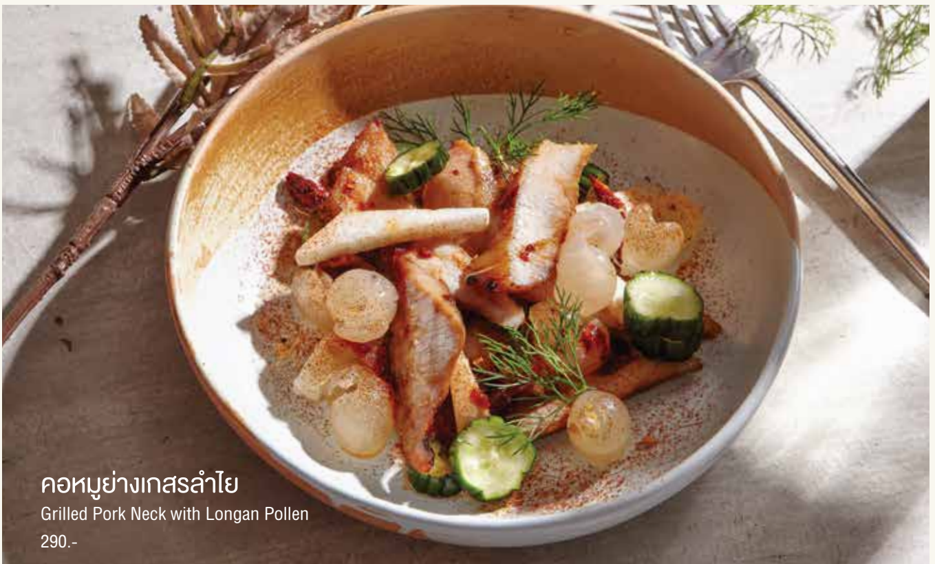
คอหมูย่างเกสรลำไย Grilled Pork Neck with Longan Pollen 290.-