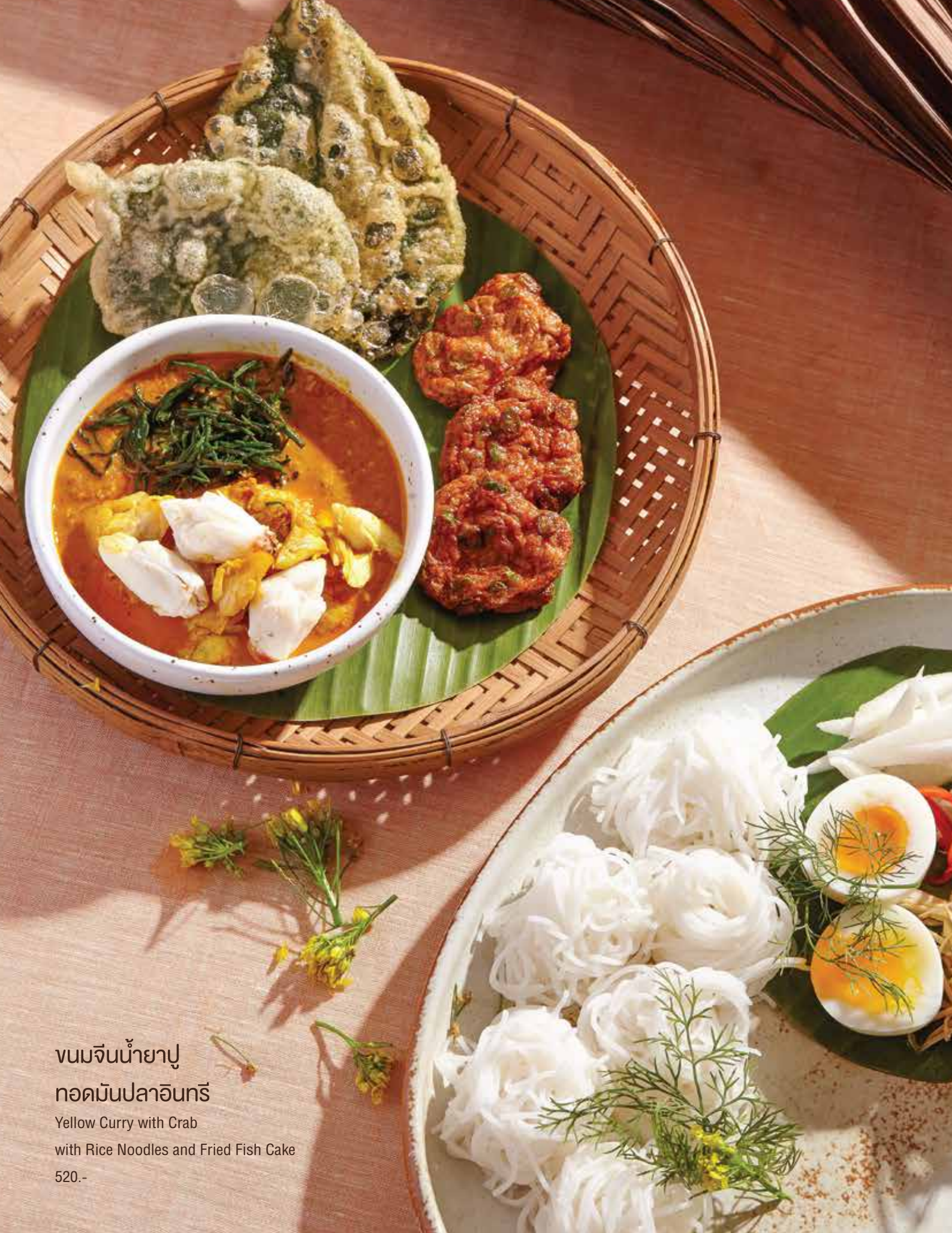
ขนมจีนน้ำยาปู ทอดมันปลาอินทรี Yellow Curry with Crab with Rice Noodles and Fried Fish Cake 520.-