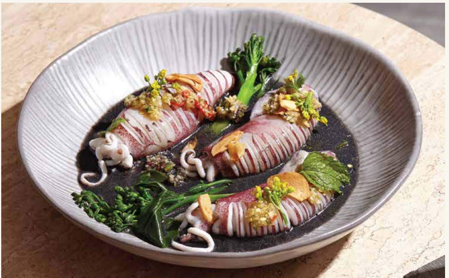
หมึกต้มมะนาวน้ำดำ 350.- Steamed Squid with Lime and Black Squid Ink Soup